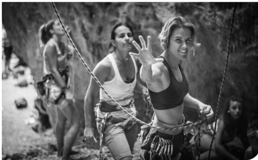
Bizitza gozatzeko beste modu bat Otra forma de disfrutar de la vida