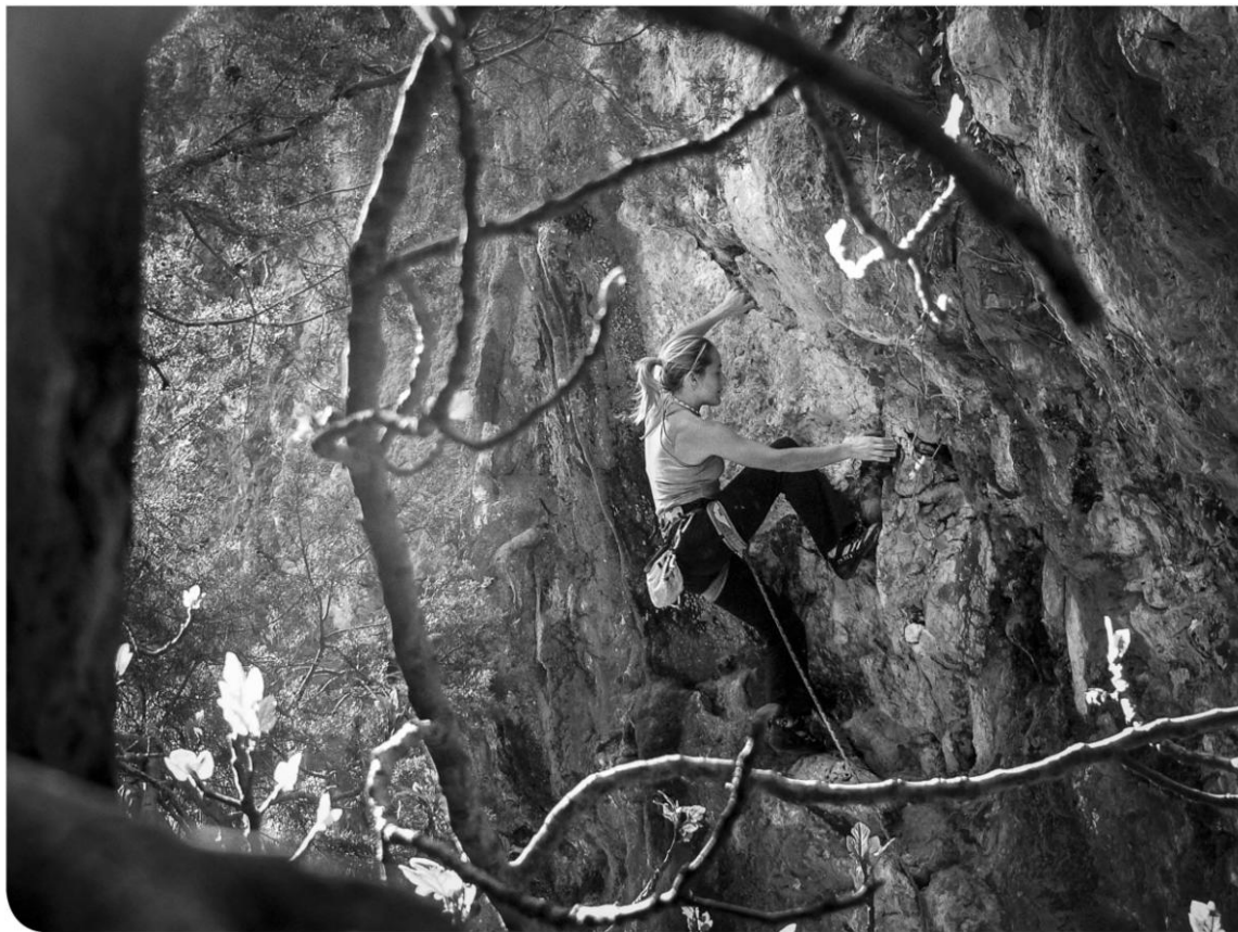
Pilar eta arroka: erronka pertsonala