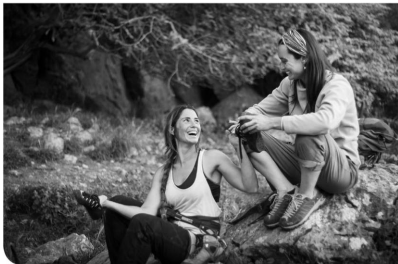
Umore ona kordada laguneren artean Buen humor entre compañeras de cordada