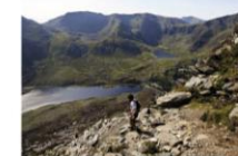
Dragon's Back Race (Reino Unido 2013), de Richard Heap.