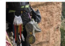
Aztarnak (País Vasco 2014), de Neskalatzaileak